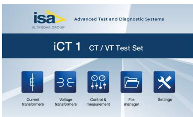
Écran Menu Principal