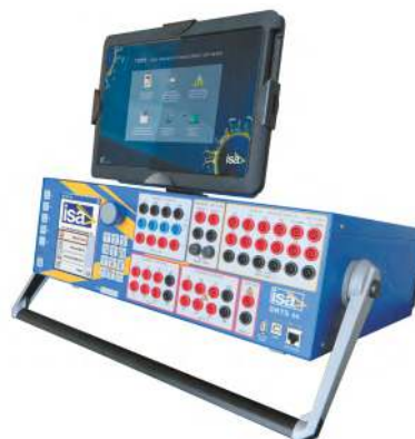
Touch Control Locale

Il tablet può essere comodamente staccato dall'unità, grazie ad un'apposita cerniera, per consentire una maggiore libertà di utilizzo da parte dell'operatore.