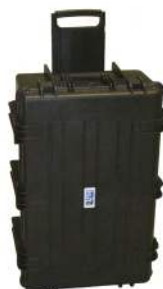
Valigia di trasporto rigida in plastica (tipo Discovery)