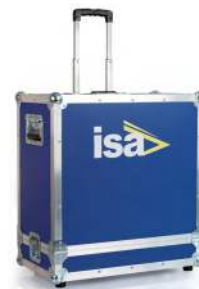
Valigia di trasporto rigida