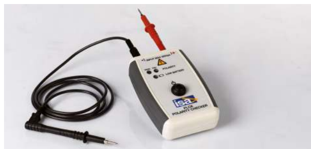
Modulo di controllo polarità PLCK

Il controllo della corretta connessione di TA e TV ai relé di protezione può essere un problema dato che i relé possono trovarsi anche a distanza di centinaia di metri dai trasformatori. Il modulo PLCK risolve questa difficoltà. Quando viene avviata la prova, DRTS 66 genera una curva speciale, non sinusoidale, che viene iniettata nei cavi di connessione. Il controllo di polarità viene eseguito facilmente collegandolo al relé. PLCK è dotato di due luci: verde e rossa. La luce verde si accende quando la polarità è corretta, quella rossa quando è sbagliata.