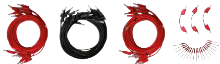
Kit opzionale cavi di prova

È possibile aggiungere questa opzione al set di cavi standard forniti per consentire la connessione a tutte le prese dello strumento. L'opzione include anche 20 adattatori e 3 ponticelli per la messa in parallelo delle uscite di corrente.