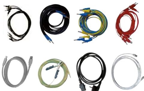
Kit standard cavi di prova