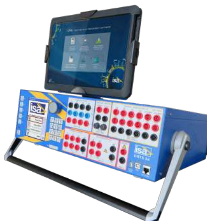
Touch Control Locale

L'opzione "Local Touch Control", consta di un tablet industriale touch screen integrato in un adeguato supporto posto nella parte superiore dell'unità, che permette di controllare la macchina attraverso applicazioni di "controllo manuale". Il tablet può essere comodamente staccato dall'unità, grazie ad un'apposita cerniera, per consentire una maggiore libertà di utilizzo da parte dell'operatore.