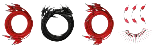
Kit opzionale cavi di prova

È possibile aggiungere questa opzione al set di cavi standard forniti per consentire la connessione a tutte le prese dello strumento. L'opzione include anche 20 adattatori e 3 ponticelli per la messa in parallelo delle uscite di corrente.