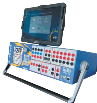
Local Touch Control

Mit der optionalen Local Touch Control kann das Gerät problemlos bedient werden. Die Steuerung erfolgt dann über den robusten Touchscreen und die Manuel Control Software. Die Local Touch Control kann zur Bedienung am DRTS 66 befestigt werden, oder abgenommen und als Steuer-Tablet verwendet werden.