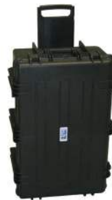
Hartschalen-Kunststoffkoffer (Discovery type)