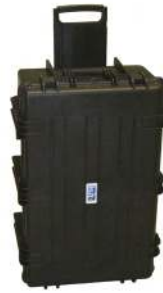
Maleta de transporte robusta en plástico (tipo Discovery)