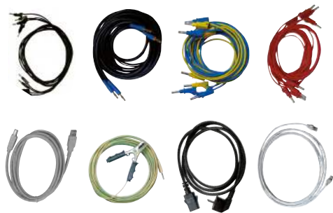
Conjunto estándar de cables de ensayo

Esta opción se puede añadir al conjunto de cables básico para conectar a todos los zócalos de los equipos de ensayo.