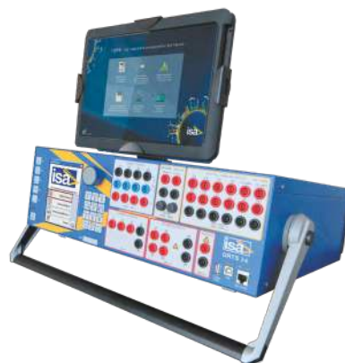
Local Touch Control

Con la opción Local Touch Control el equipo puede ser manejado fácilmente utilizando una pantalla táctil muy robusta y con las aplicaciones del software de control manual. El Local Touch Control se puede utilizar conectado o desconectado del DRTS34. Cuando se utiliza conectado al equipo de ensayo el resistente Touch Local Control está fijado al equipo mediante un robusto módulo con bisagras. Si está desconectado del equipo de ensayo el módulo Local Touch Control se puede manejar como una robusta tableta de control.