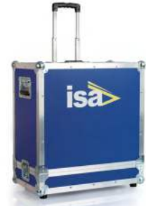
Maleta de transporte robusta